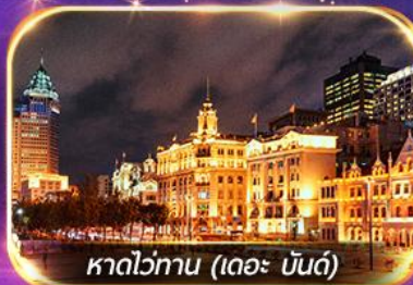
หาดว่อกาน (เดอะ บันด์)

เที่ยวดิสนีย์แลนด์เต็มวัน (รวมรถรับ-ส่ง)