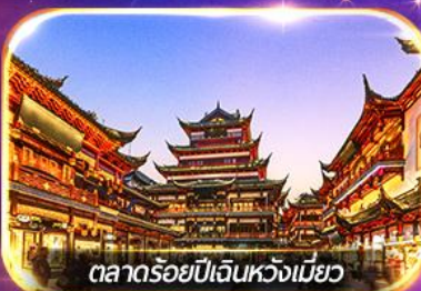
ตลาดร้อยปีเงินหวงเหมียว