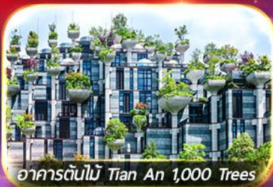
อาคารต้นไม้ Tian An 1,000 Trees