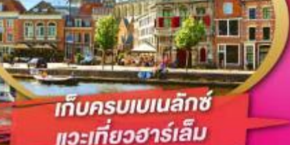
เก็บครบเบเนลักซ์ แวะเที่ยวฮาร์เล็ม