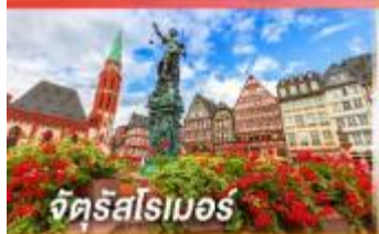
จัตุรัสโรเมอร์