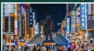
ถนนแดนดินแดงชิงคู่