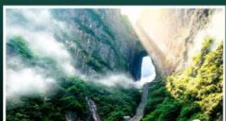
เขาประตูลสวรรค์