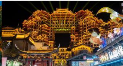
ตีทมห้ศจสรย์ 72