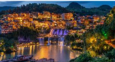
หมู่บ้านโบราณฝูหรงเจิน