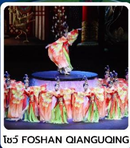
โชว์ FOSHAN QIANGQING