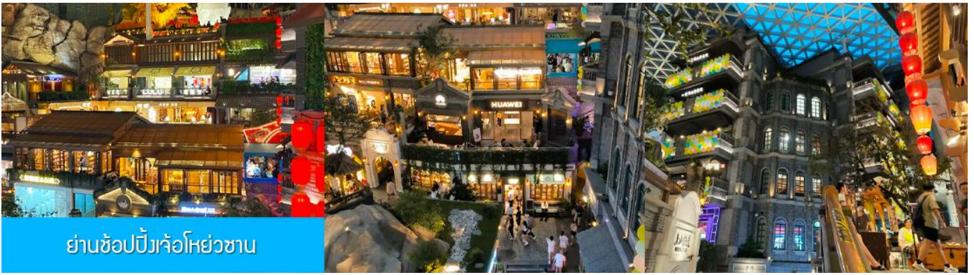
ย่านช้อปปิ้งเจ้อห้วยซาน

นำท่านเที่ยวชม ย่านช้อปปิ้งเจ้อห้วยซาน 这有山 แหล่งช้อปปิ้งจีนชื่อที่ผสมผสานระหว่างสถานที่ท่องเที่ยว และแหล่งรวมร้านค้า และร้านอาหารฟาสต์ฟู้ด อาหารพื้นเมืองร่วมสมัย ภายใต้คอนเซ็ปต์ แหล่งช้อปปิ้งบนภูเขา และบนภูเขามีแหล่งช้อปปิ้ง เป็นจุดเช็คอินยอดนิยมที่เปิดให้คนพื้นที่และนักท่องเที่ยวเข้าชมตั้งแต่ปี ค.ศ. 2019