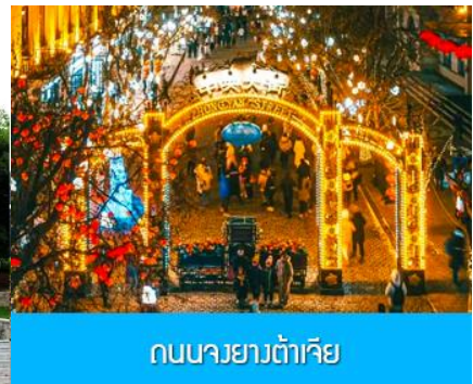
ถนนยาวต้าเจีย