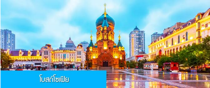
โบสถ์โซเฟีย

รับประทานอาหารเช้า ณ ห้องอาหารของโรงแรม (10)