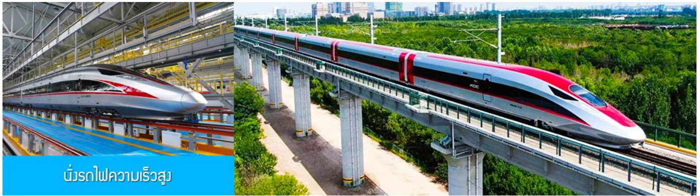
บริการรถไฟความเร็วสูง