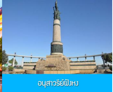
อนุสาวรีย์พิงหว

หลังอาหารนำท่านชม โบสถ์ เซนต์โซเฟีย 索菲亚教堂 (ชมด้านนอก) อีกหนึ่งสัญลักษณ์ที่โดดเด่นของเมืองฮาร์บิน สร้างขึ้นในปี ค.ศ. 1907 เป็น โบสถ์คริสต์นิกายออร์ทอดอกซ์ ที่ใหญ่ที่สุดในเอเชียตะวันออกเฉียง ที่แสดงถึงอิทธิพลของวัฒนธรรมรัสเซียที่มีต่อเมืองฮาร์บิน