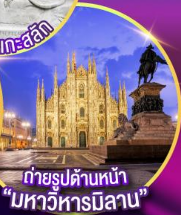
ถ่ายรูปด้านหน้า "มหาวิหารมิลาน"