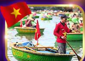
เรือกระด้ง หมู่บ้านก๊อตัน