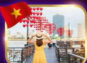
เช็คอินสะพานแห่งความรัก