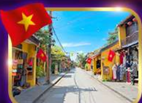
เมืองเก่ามรดกโลก ฮอยอัน