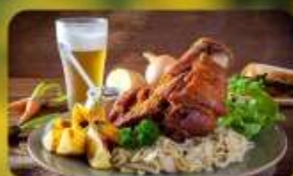
พิเศษ! ลิ้มลองเมนูประจำชาติ ทั้ง 5 ประเทศ!!!