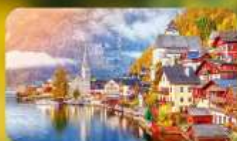
การันตีที่พัก Hallstatt / St. Wolfgang หรือริบทะเลสาบ 1 คืน