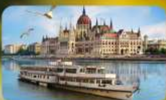
ล่องเรือแม่น้ำดานูบ พร้อมจิบแชมเปญ