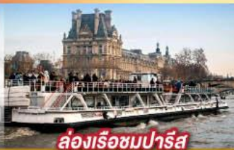
ล่องเรือชมปารีส