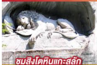
ชมสิงโตหินแกะสลัก