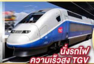
นั่งรถไฟ ความเร็วสูง TGV