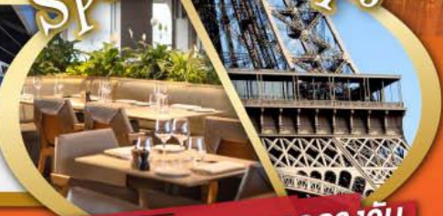
รับประทานอาหารกลางวัน บนหอไอเฟล