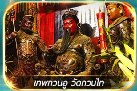
เทพกวนอู วัดกวนไท

พามุไหว้พระ-ขอพร 8 วัดดัง, อิสระช้อปปิ้ง 1 วันเต็มแบบจุใจ