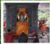
โต๋ซ่งกง