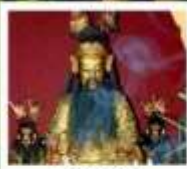
เฮียงบู๊ซิว