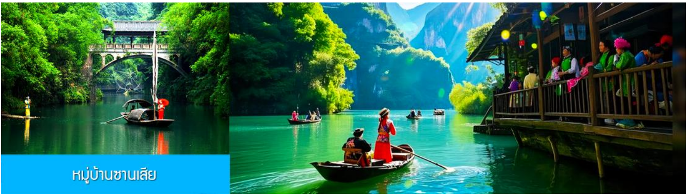
หมู่บ้านซานเสี