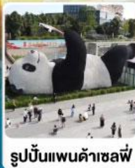
รูปปั้นแพนด้าเซลฟ์