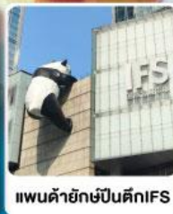
แพนด้ายักษ์ปีนตึกIFS