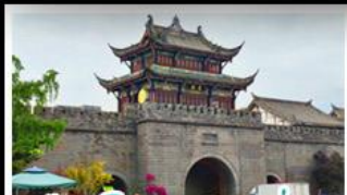
เมืองโบราณกวนเซี่ยน

ภูเขาสี่ดรุณี - อุทยานป่ฝิ่งโกว - สะพานหนานเฉียว - ร้านหนังสือจงซูเก้อ - เมืองโบราณกวนเสียน จตุรัสหย่าเทียนหวู่ - หมีแพนด้าเซลฟี - ถนนโบราณซอหยวงซอเย่ - ถนนคนเดินไท่กู่หลี่ ถนนคนเดินซุนซี - ถนนโบราณจิ่นหลี่ - แพนด้ายักษ์ปิงตึก - น้ำพุไม้ไผ่ตึกSKP - วัดต้าเจี๊ว