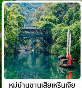
หมู่บ้านซานเสี่ยเหรินเจีย