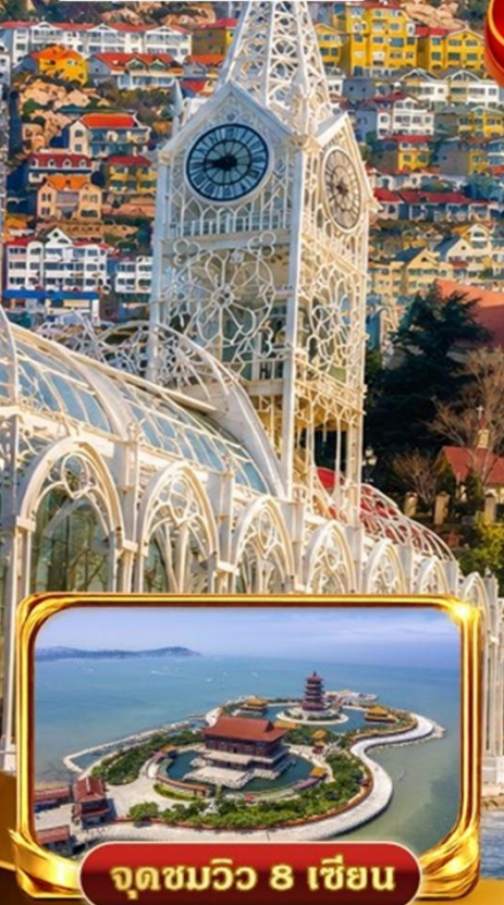
จุดชมวิว 8 เชียง