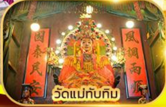
วัดแม่ทับทิม