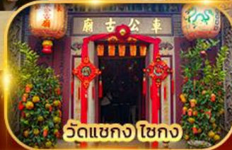
วัดแขก ไชกง