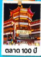
ตลาด 100 ปี