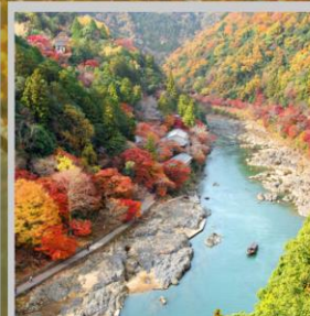
"ARASHIYAMA MT. KAMEYAMA"