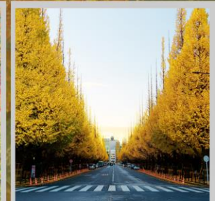
"ICHONAMIKI GINGO AVENUE"