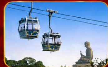
กระเช้านองปิง