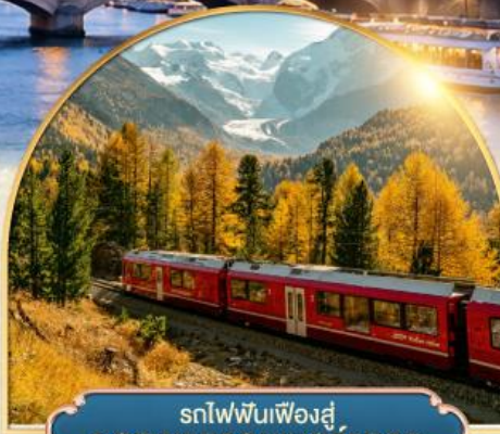
รถไฟพินเฟองสู่ยอดเขากรอนเนอร์ต