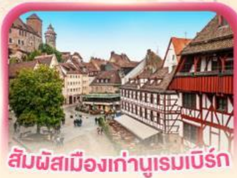
สัมผัสเมืองเก่าบูเรมเบิร์ก