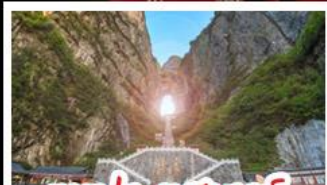
เขาประตูลั่วตี้