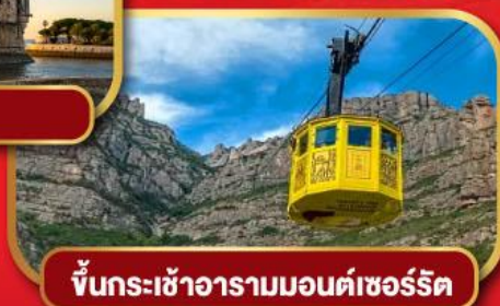
ขึ้นกระเช้าอารามมอนต์เซอรัลด์