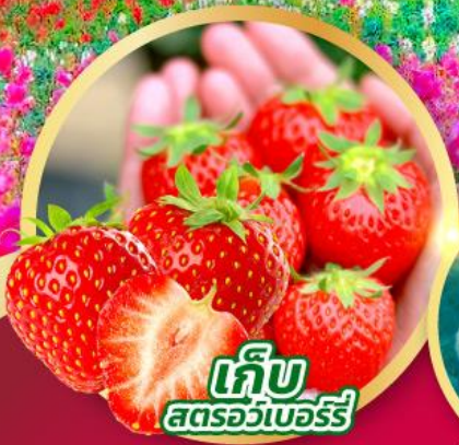
เก็บ สตอร์วเบอร์รี่