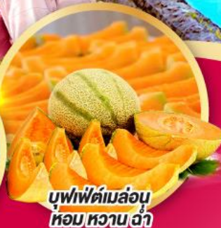
บุฟเฟ่ต์เมล่อน หอมหวานซ่า