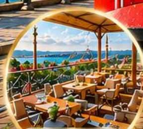
Seven Hills Cafe ชมวิว อิสตันบูล