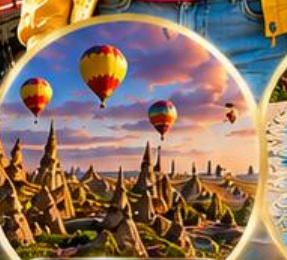
เมืองคัปปาโดเกีย Cappadocia