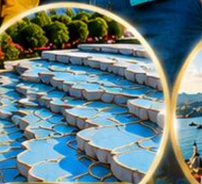
ปามุกคาล์ Pamukkale