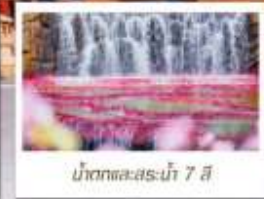
น้ำตกทะเลสาบไห่ 7 สี

🗳️ โหลด 23 KG. x1 ทิ้งไป - กลับ ✓ ฟรีนียบตัว ✓ ไม่เข้าร้านรัฐบาล ✓ ทีวีรูปเล็ก ✓ รวมค่าเข้าสถานที่ตามโปรแกรม