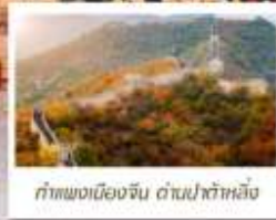
กำแพงเมืองจีน ด่านปาต้าหลิ่ง