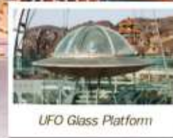
UFO Glass Platform