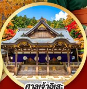
ศาลเจ้าอิสะ