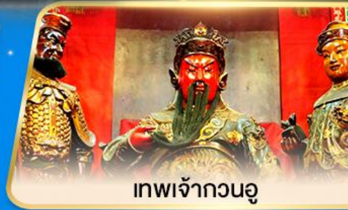
เทพเจ้ากวนอู