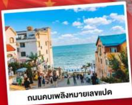
ถนนคอปเปลิ่งหมายเลขแปด