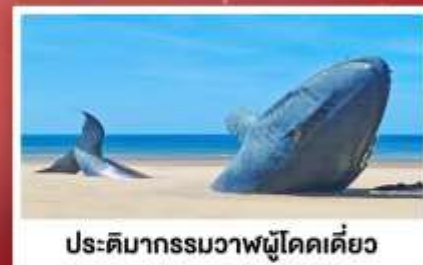
ประติมากรรมวาฬผู้โดดเดี่ยว