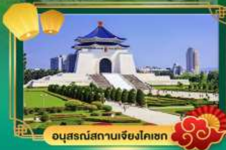
อนุสรณ์สถานเจียงไคเชก