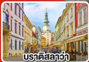
ปราติสลาว่า

เที่ยวเมือง คาร์โลวารี เมืองแห่งสปา พร้อมเมนูพิเศษเปิดโบฮีเมีย