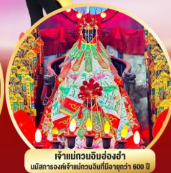
เจ้าแม่ทวนอิมฮ่องฮ่า นมัสการองค์เจ้าแม่ทวนอิมที่มีอายุกว่า 600 ปี