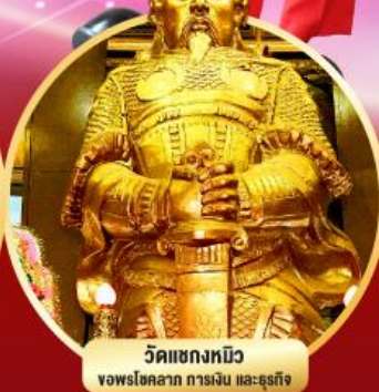
วัดแชกงหมิว ขอพรโชคลาภ การเงิน และธุรกิจ