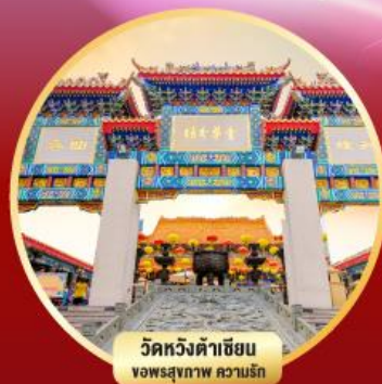
วัดหวังต้าเซียน ขอพรสุขภาพ ความรัก