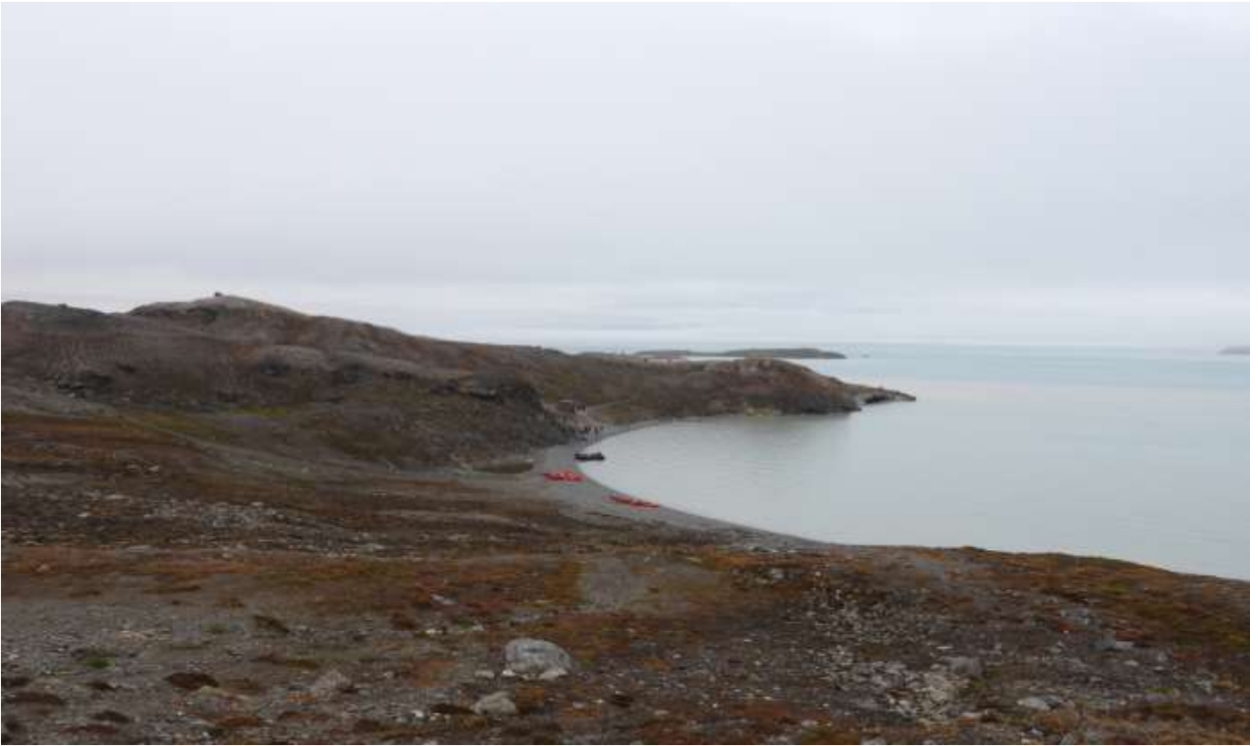
เขตอนุรักษณ์ธรรมชาติซอร์ราสต์ (Soraust Svalbard Nature Reserve)

เป็นเกาะขนาดเล็กทางตอนเหนือของสวาลบาร์ด มีพื้นที่เนินเขาเตี้ยๆและอยู่ใกล้กับธารน้ำแข็งทางตอนเหนือของสวาลบาร์ดอีกด้วย ที่นี่ได้รับการขนานนามว่า อ่าวแห่งรัก (Love Bay) ท่านจะได้ชื่นชมทัศนียภาพและความสวยงามของอ่าว รวมถึงสัตว์ไม่ว่าจะเป็นหมีขาว แมวน้ำ ที่มีถิ่นอาศัยในบริเวณนี้เช่นกัน