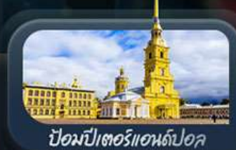
ป้อมปีเตอร์แอนด์ปอล