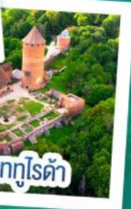
ปราสาทกูโรต้า