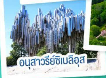
อนุสาวรีย์เซเบลิอุส