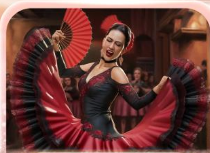
ระบำฟลามิงโก