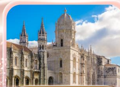
มหาวิหารเจอรูนิโม