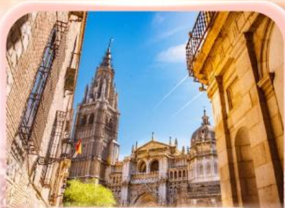
มหาวิหารแห่งโกเอลดา